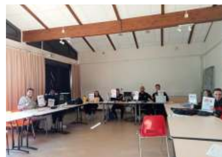
Événements multiplicateurs en France