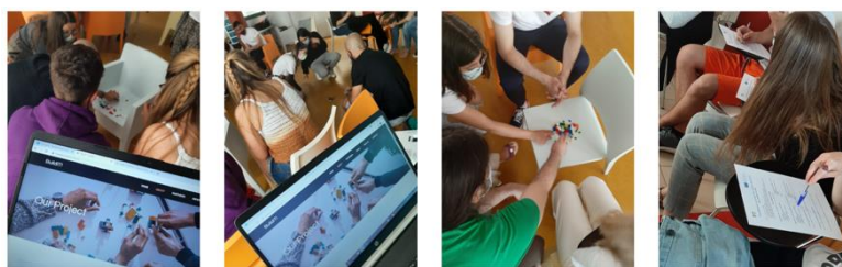
Les apprenants adultes expérimentant les activités BBU en Espagne