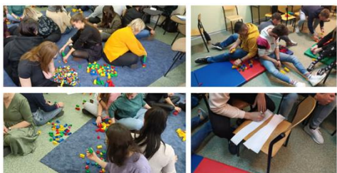
Les apprenants adultes expérimentant les activités BBU en Pologne

Téléchargez le rapport ici et le résumé ici